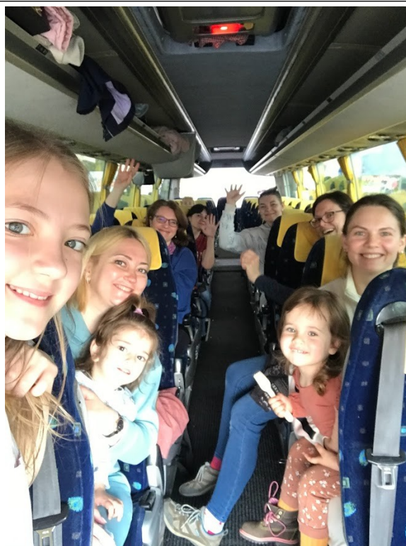
Od začátku s úsměvem.