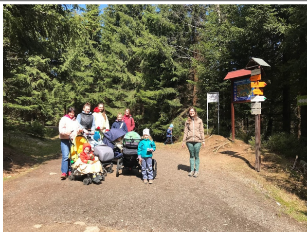
Výlety, kočárky a kopce.